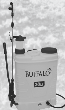
BF 20L (Modelo Elétrico e Manual)

PEÇAS E GARANTIA EM TODO O TERRITÓRIO NACIONAL